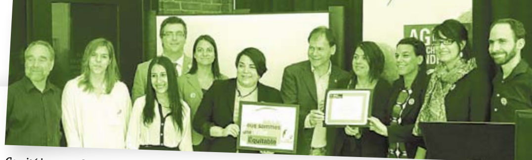
Comité jeunesse 2014

Deux rencontres au cours de l'année en lien avec la rédaction.